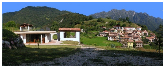
A sinistra vista esterna del futuro centro presso Moerna

Al centro della valle ( gemellata con lo splendido promontorio di S. Rocco), esiste Pralta, una montagna a forma esattamente piramidale che funziona da catalizzatore ed emanatore di energie positive. Ciò di cui abbiamo bisogno, oggi in modo notevole.